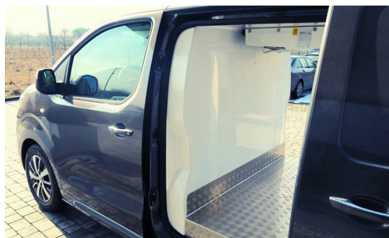
Funkcjonalne drzwi boczne Także lewe i prawe jednocześnie