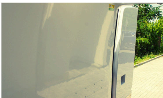
Zabudowa z laminatu Highline Idealnie gładki laminat najwyższej jakości, łatwy do utrzymania w czystości