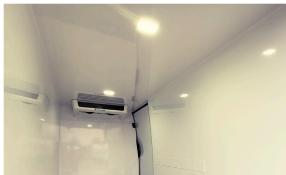
Oświetlenie LED Energoszczędne i hermetyczne