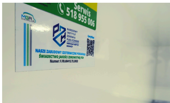
Atest PZH Nasze zabudowy posiadają atest do przewozu żywności i artykułów spożywczych