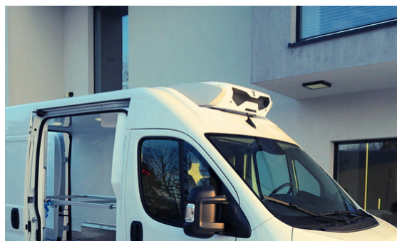
Agregat na dachu w niszy Z opcją lakierowania w kolor nadwozia