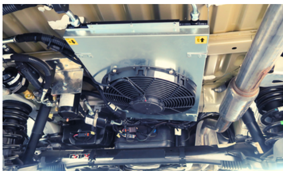
Agregat pod podłogą "Niewidzialny agregat" od spodu auta